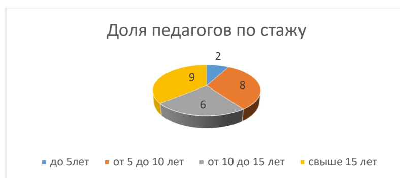
Рисунок 2. Анализ состава педагогов по стажу

Анализ кадрового состава в сравнении с 2024 годом показывает следующие: